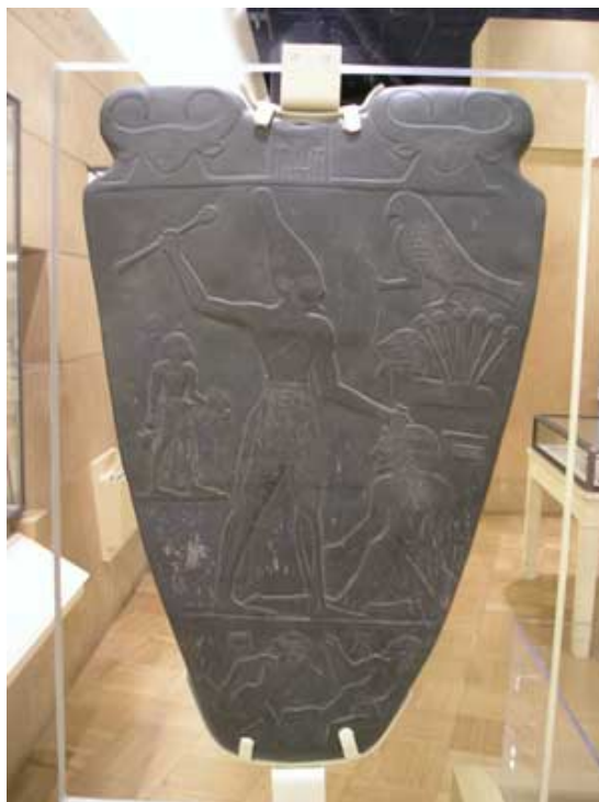
La palette de Narmer (arrière), Royal Ontario Museum, Toronto

Dès l'Ancien Empire, on trouve dans les Textes des Pyramides le cheminement du roi défunt qui, avant de gagner une place auprès du Dieu, se dirigeait d'abord vers Hathor (symbolisé par la vache), régnant sur l'Océan primordial : c'est le chemin de la renaissance.