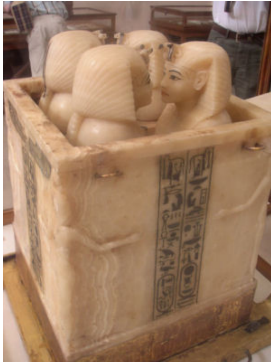
Vases canopes de Toutankhamon exposé au musée du Caire, photo de Vincent Euverte.