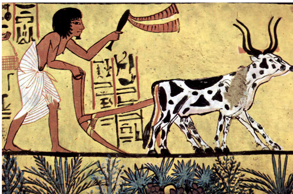
Chambre funéraire de Sennedjem, Scène de labourage.

La domestication des animaux en Égypte a probablement débuté dès le Néolithique. Sous l'Ancien Empire (de -2278 à -2260). Ce pays a vu cohabiter deux espèces de bœufs. Le bœuf ioua (ou Bos Africanus de son nom savant) n'était pas un animal de travail. Il était destiné exclusivement à la boucherie. Il semble que les Égyptiens n'aient pas réussi à l'élever et qu'ils l'importaient par bateaux entiers de la Nubie supérieure avant de les engraisser dans des étables. La seconde espèce était celle du bœuf neg, encore présent aujourd'hui dans une grande partie de l'Afrique. Bien acclimatés au climat de la vallée du Nil, ces bœufs paissaient en de larges troupeaux dans les prairies du delta. Pendant les grosses chaleurs, les bergers qui encadraient ces troupeaux les emmenaient se baigner dans les eaux profondes du Nil tout en écartant les crocodiles grâce à des formules magiques.