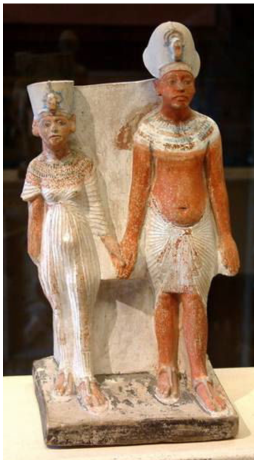
Nefertiti en compagnie d'Akhenaton, son époux, exposé au Musée du Louvres, Paris