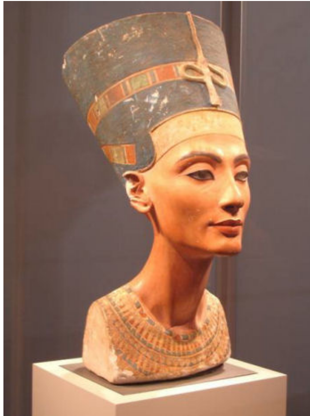
Buste de Nefertiti, vers 1340 avant J.-C., exposé au musée de Berlin

Nefertiti, alors qu'elle n'était qu'une jeune femme, épousa le fils d'Aménophis III, seulement âgé de 12 ans. C'est en 1350 avant J.-C. que ce fils monta sur le trône d'Egypte et prit le nom d'Aménophis IV (« Amon est satisfait »). C'est ainsi que Nefertiti devint reine et Grande Epouse Royale.