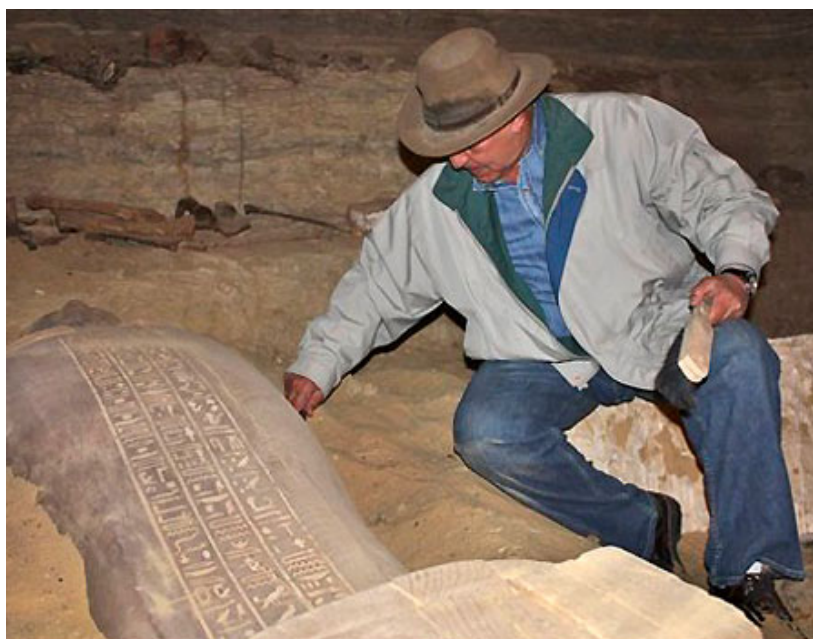
Zahi Hawass dans la tombe contenant les momies

Le site de Saqqarah est une vaste nécropole de la région de l'ancienne Memphis, où se trouvent d'innombrables tombes et les premières pyramides pharaoniques. Lundi 9 février 2009, Zahi Hawass, le patron des antiquités égyptiennes, a annoncé la découverte de 30 momies dans une tombe pharaonique ancienne de 4.300 ans, à Gisir al-Moudir, aux abords du Caire à l'ouest de Saqqarah.