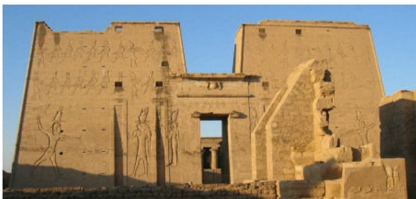
Grand pylônes vue du mammisi