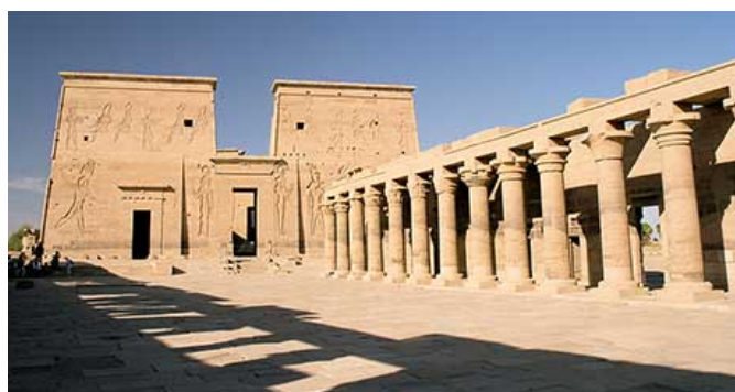
Le temple d'Isis sur l'île de Philae, près d'Assouan, Egypte

Outre le côté militaire, pour que son nom ne soit jamais oublié, le pharaon pouvait s'improviser « grand bâtisseur ». Par exemple, il avait reçu des dieux la mission de construire des temples en leur honneur. C'est ainsi que des sanctuaires magnifiques ont vu le jour comme celui dédié à la déesse Isis sur l'île de Philae. Ce temple fut construit pendant la période ptolémaïque et permit au culte de cette divinité de perdurer encore pendant des siècles. En effet, ce n'est qu'en 550 après Jésus-Christ que ce temple, regroupant les derniers fidèles d'Isis, fut fermé sur ordre de l'empereur byzantin Justinien Ier, adepte du christianisme.