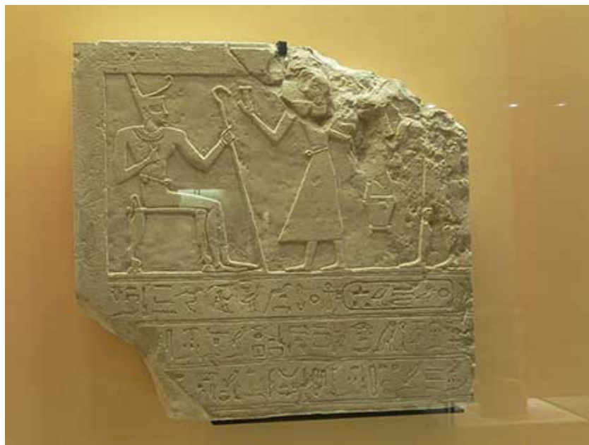
Stèle d'un pharaon de la XIème dynastie : Montouhotep, Musée du Louvre, France

Pour lire une inscription égyptienne, il faut d'abord commencer par trouver le sens de lecture. Pour cela, il convient de repérer dans quelle direction regardent les êtres vivants (aussi bien les humains que les animaux). Ensuite, la règle est simple : leur regard est toujours orienté vers le début de l'inscription. Ainsi, sur la première ligne de cette stèle, on lit de droite à gauche. Hélas, comme elle est assez endommagée, nous vous avons reproduit la ligne qui nous intéresse (mais le sens de lecture a été adapté aux langues occidentales modernes, de gauche à droite) :