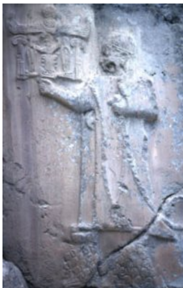
Bas-relief représentant le souverain hittite Tudhaliya IV, près d'Ankara, Turquie

représentant les rois ou même les dieux.