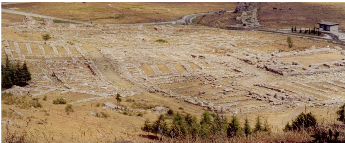
Ruines du Grand Temple d'Hattusa

Classiquement, le culte était pratiqué dans un temple qui renfermait une statue de la divinité. Elle pouvait en sortir lors des différentes fêtes et manifestations religieuses.